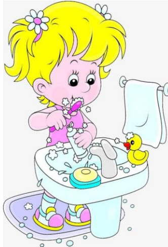
I clean my teeth