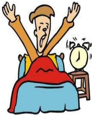
I wake up

Творче завдання: Намалюй, що ти робиш вранці і підпиши свої дії. Наприклад: