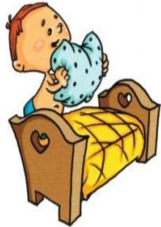
I make my bed

Завдання для повторення вивченого матеріалу: